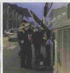
La partenza del pullman del CUS dalla Bicocca e i partecipanti alla gita; in alto, un giovane studente sullo snowboard